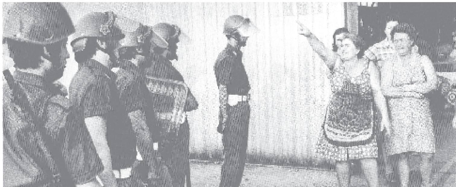
Ρώμη 1974 & 1977 από το: Tano d' Amico, Una storia di donne: Il movimento al femminile dal '70 agli anni no global, Intra Moenia, Napoli 2003.

οικογένειες στις εργατικές κατοικίες του Quarto Oggiaro ήρθαν αντιμέτωπες με αύξηση ενοικίου κατά 30%, δημιουργήθηκε μια ένωση ενοικιαστών. Εκείνη την χρονιά έκαναν επαφές πόρτα-πόρτα και οργάνωσαν δημόσιες συναντήσεις. Μέχρι τον Ιούνιο του 1968, 700 οικογένειες βρίσκονταν σε ολική απεργία ενοικίου. Η ένωση ενοικιαστών διέδωσε τον αγώνα αυτόν προπαγανδίζοντας πως το νοίκι δεν μπορεί να είναι πάνω από το 10% του μισθού. Τον Σεπτέμβριο της ίδιας χρονιάς 4 άτομα συνελήφθησαν κατά τη διάρκεια έξωσης. Παιδιά επιτίθονταν σε περιπολικά και οι γυναίκες έφραζαν τα σκαλιά που οδηγούσαν στα διαμερίσματα. Η ένωση επεκτάθηκε και η αστυνομική βία εξόργιζε ακόμη περισσότερο τον κόσμο. Τον Απρίλη του 1970 χρειάστηκαν 500 αστυνομικοί για να κάνουν έξωση σε μία μόνο οικογένεια.